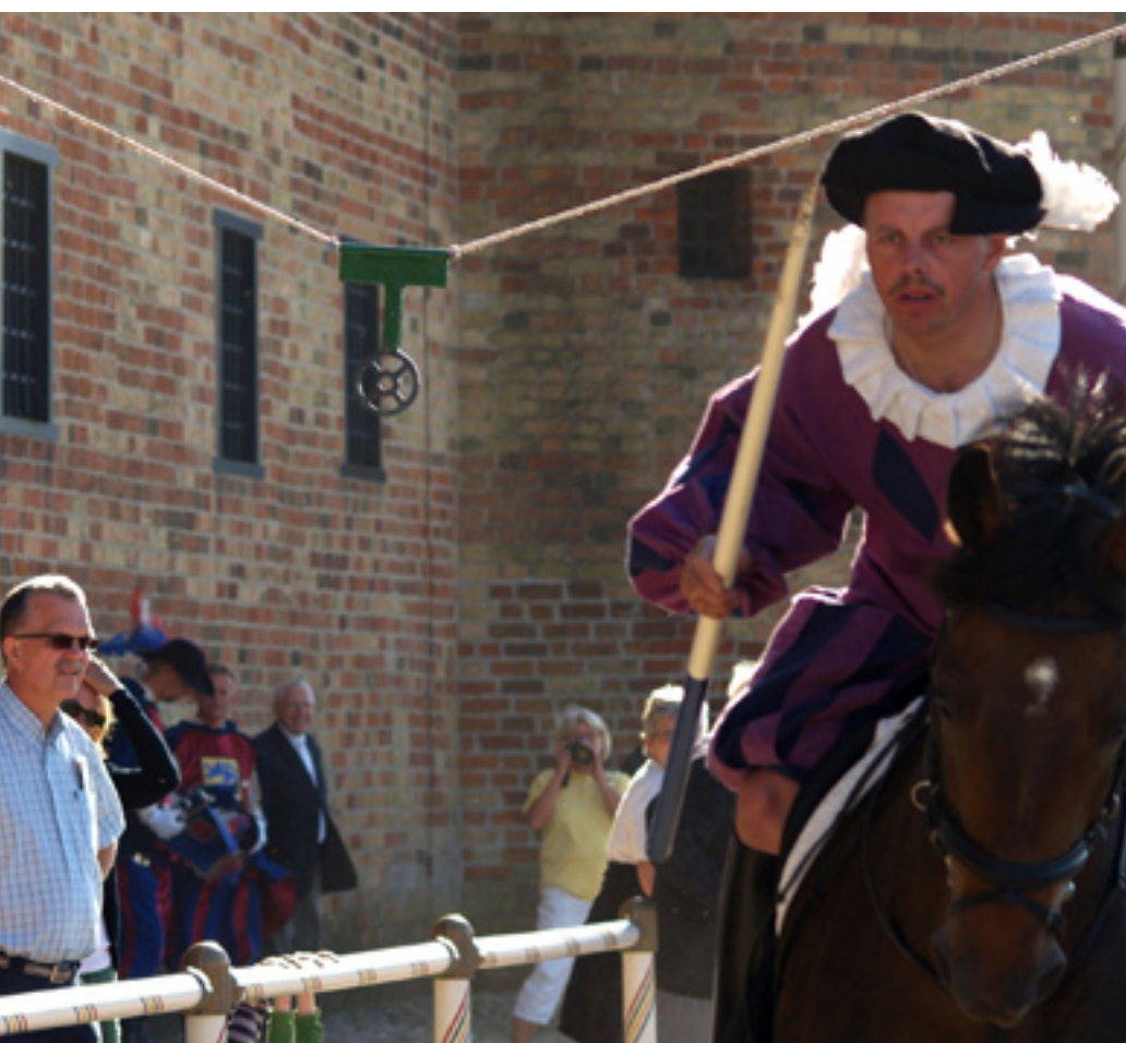
Spänning. Upplev Götene på medeltida vis i sommar.