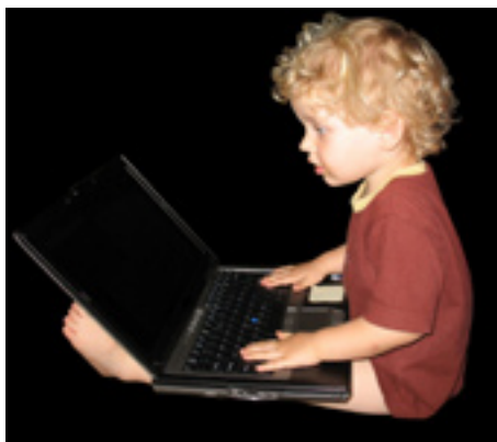
Smidigt. På www.gotenebostader.se kan du läsa nyheter och göra felanmälingar.

Det är även bra att gå in på hemsidan, www.gotenebostader.se , med jämna mellanrum för att få akutell information och nyheter.