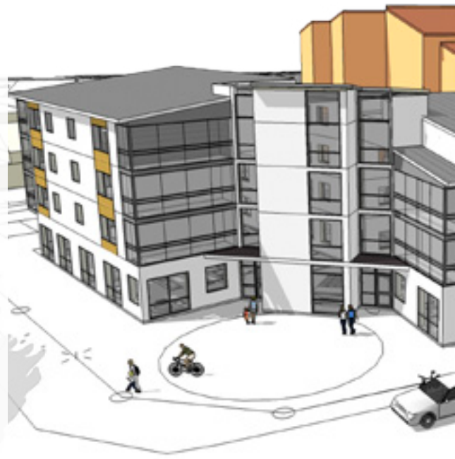
Det nya trygghetsboendet får 22 lägenheter och blir ett så kallat lågenergihus.

"Det blir ett stort lyft för Götene tätort och kommer att försköna centrum."